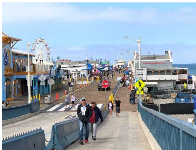
海風が心地よく吹く初夏のサンタモニカ・ピア（5月13日、カリフォルニア州）