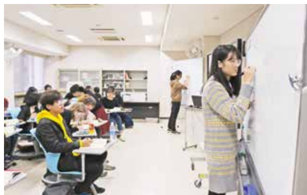
日本語の授業 Japanese Language Classes