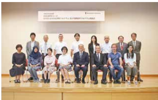
開講式 Opening Ceremony