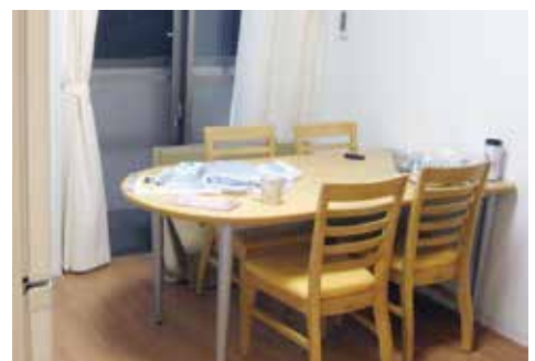
留学生寮 - 国際交流会館 Student Dormitory, International House