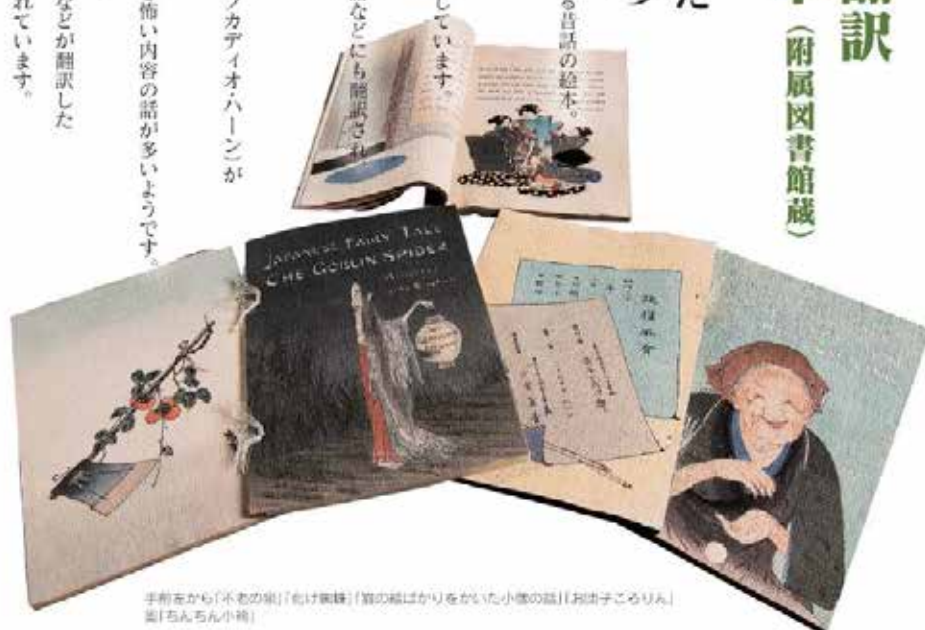
手前左から「不老の泉」「色けぬ縁」「算の結ばかりをいた小僧の話」「お漬子ころりん」 表「ちんちん小僧」