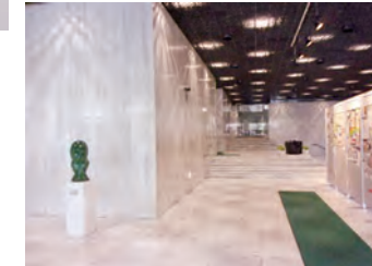
ビルエントランス内部