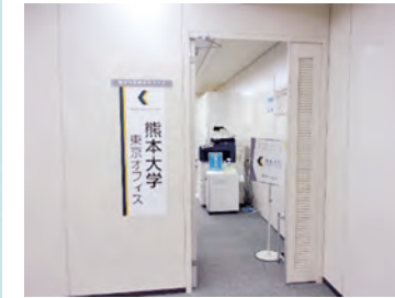
東京オフィス入口