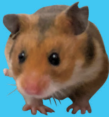
冬眠するハムスター