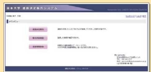
進路決定報告システムトップ画面