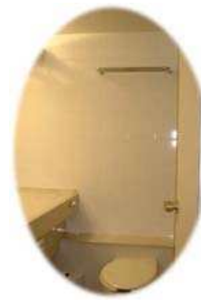
バスルーム(宿泊室内)