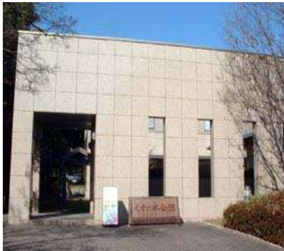
くすの木会館玄関