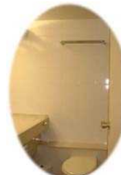
バスルーム (お部屋内にあります)