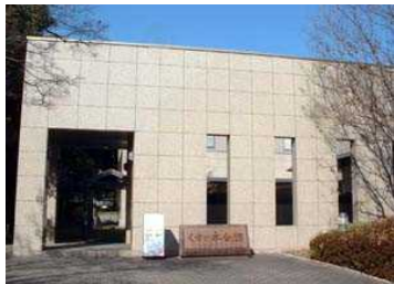
くすの木会館玄関