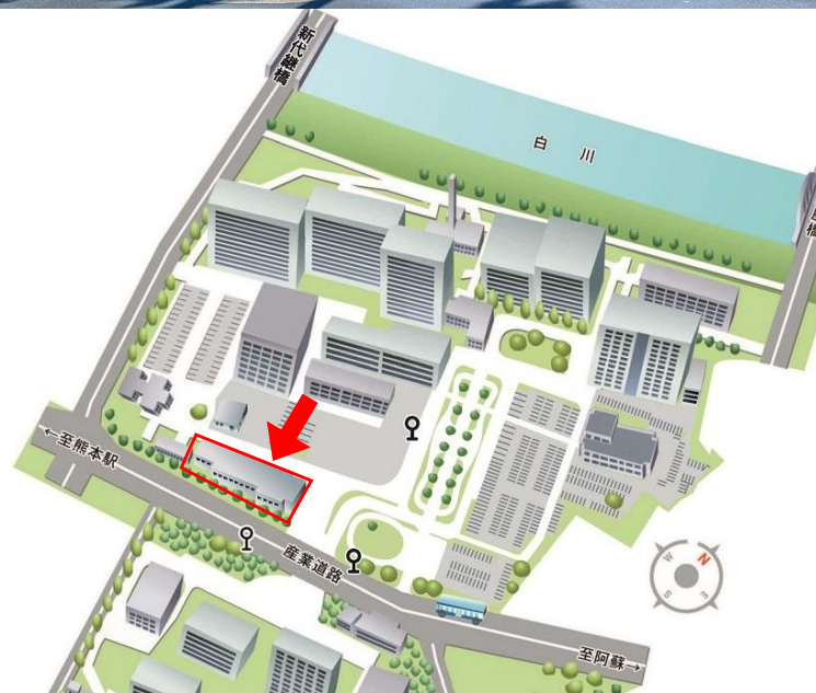
本荘キャンパス(北地区)