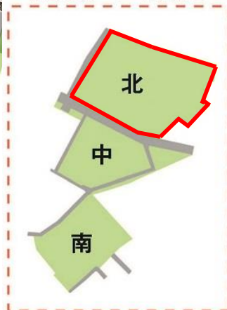
本荘北・中・南地区