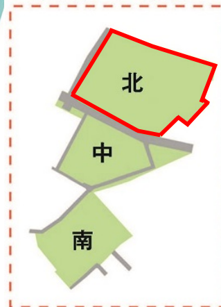
本荘北・中・南地区