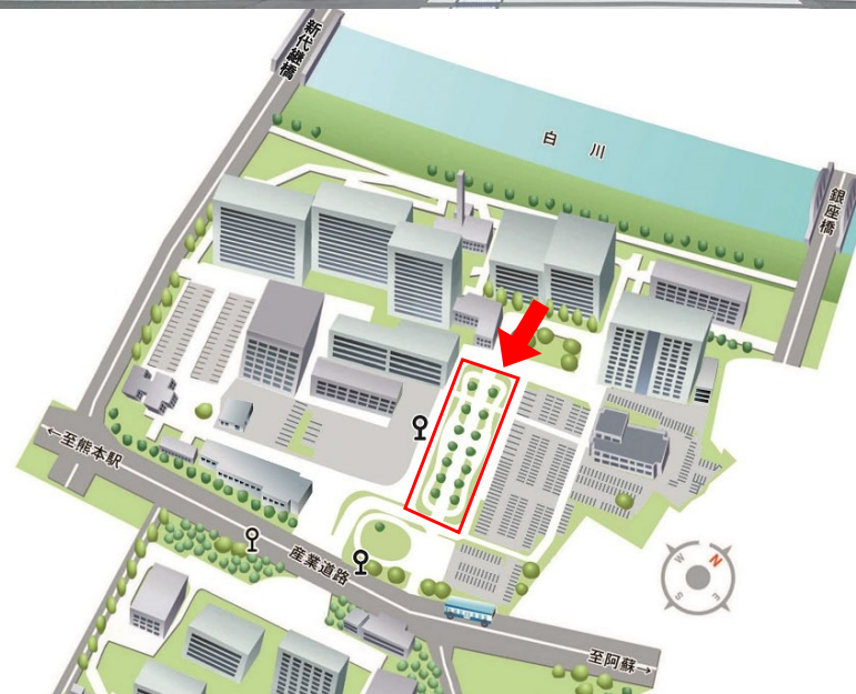
本荘キャンパス(北地区)