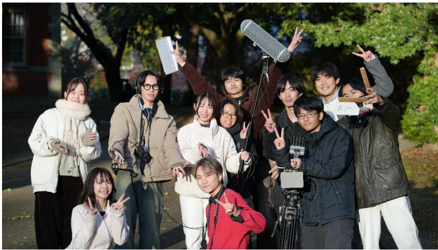
映画研究部の学生たち