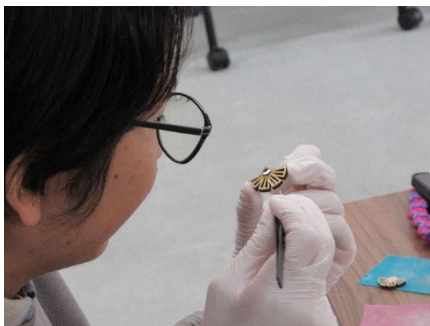
（教育学部美術科学生たちによる制作中の様子）