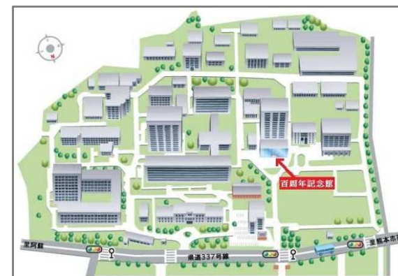
熊本大学黒髪南地区

Mail szk-projectapply@jim.u.kumamoto-u.ac.jp