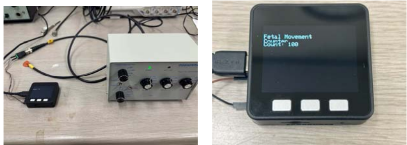
図2 胎動カウンターシステムとその胎動カウンター画面