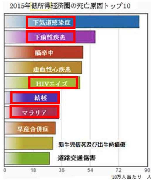
WHOファクトシートより

感染症は未だ世界の脅威であり、特に医療資源が乏しい国において多くの命を奪っている